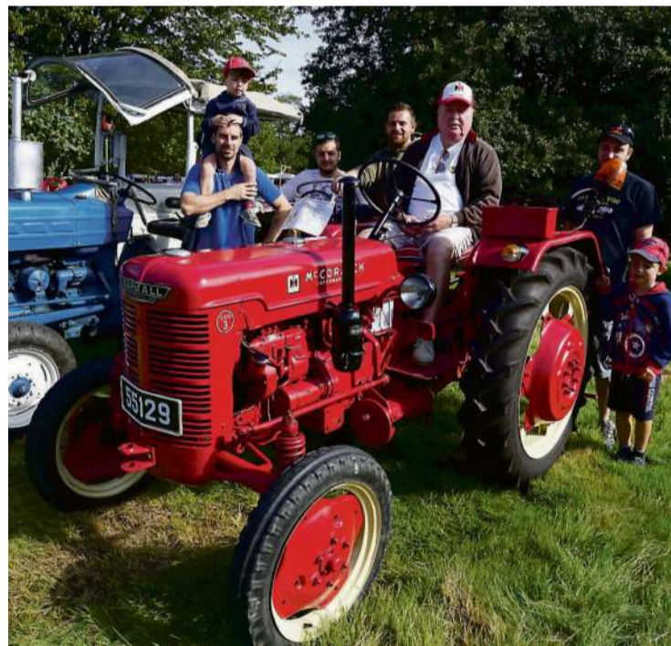
Trekker-Fahren - ein Hobby für Jung und Alt