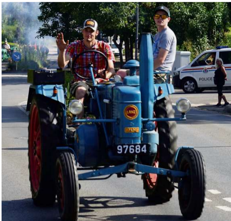
Lanz war berühmt für seine Einzylinder-Glühkopfdiesel