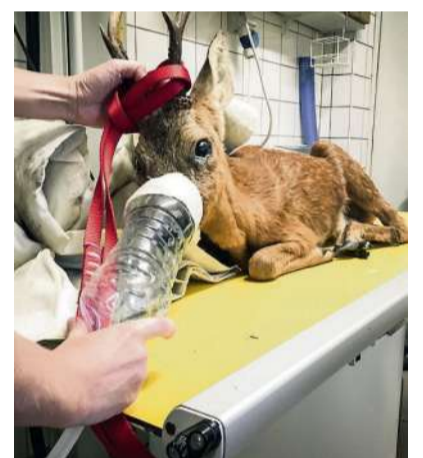
Ein besonderer Einsatz

SCHIFFLINGEN Zu einem ganz besonderen Einsatz wurden die Wachhabenden des Schifflinger Einsatzzentrums am Wochenende gerufen. Ein Reh hatte offenbar so die Orientierung verloren, dass es hilflos im Ort umher irrte. Die Rettungskräfte lasen das verängstigte und unterernährte Tier auf, versorgten es mit Sauerstoff und brachten es dann zur Düdelinger Auffangstation für Wildtiere. LJ