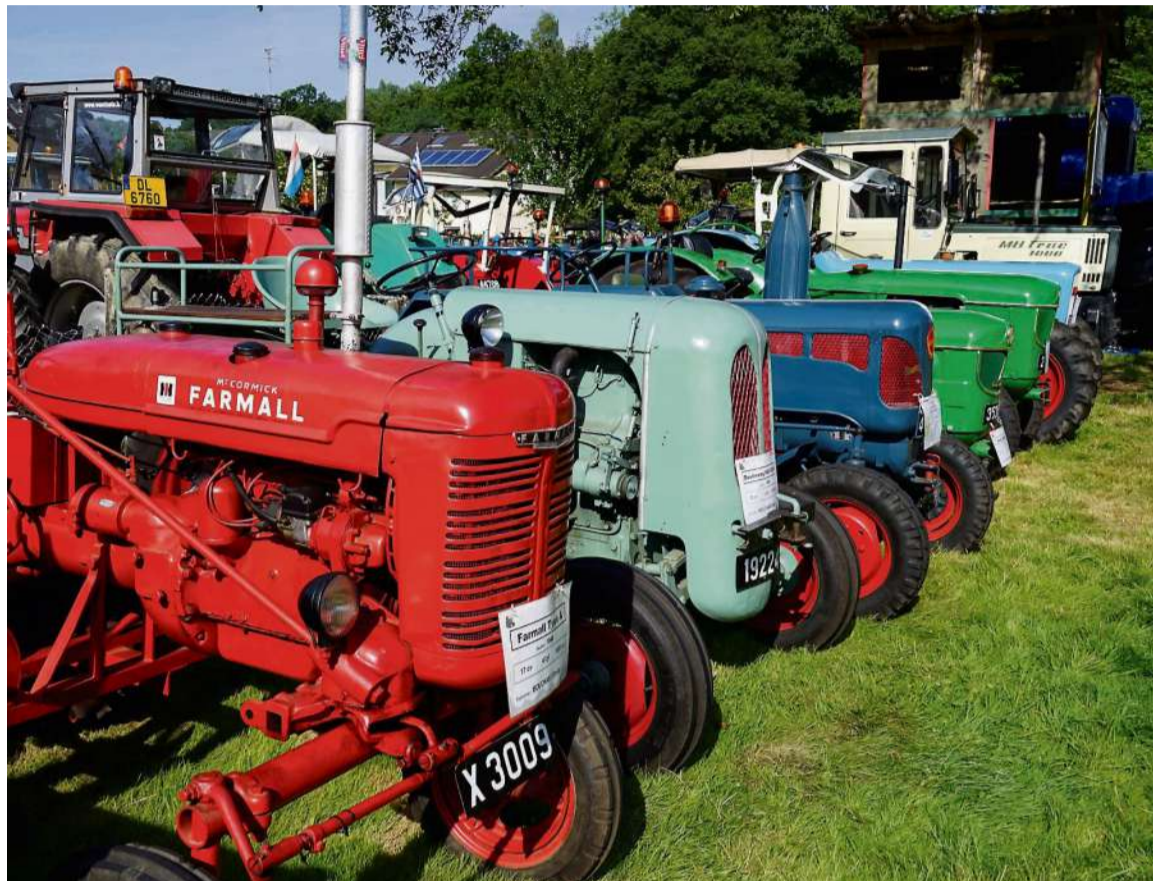
Eine bunte und beeindruckende Reihe, vom McCormick bis zum auch schon historischen MB-Trac

Den ganzen Tag über sollten bei Kaiserwetter beim „9. Internationales AT-Traktortreffen“ die Freunde dieser Maschinen voll auf ihre Kosten kommen. Bei Volksfestambiente ließen sich liebevoll restaurierte und für diesen Tag besonders aufpolierte Trekker bestaunen. Wer das satte Wummern des Ein-Zylinder Motors eines 80 Jahre alten Lanz Bulldogs liebt; zusehen möchte, was es so alles braucht, um einen Schlüter AS22 aus dem Jahr 1955 zu starten, oder wissen will, wie man einen McCormick DEDS von 1956 instand hält, oder wie ein Eicher EM600 S sich beim Geschicklichkeitsfahren schlägt, erfährt es zum Beispiel bei diesem alle zwei Jahre vom „Kulturell Reanimatioun Keispelt-Meespelt“ organisierten Meeting, zu dem auch eine Rundfahrt durch das Dorf gehört. ●